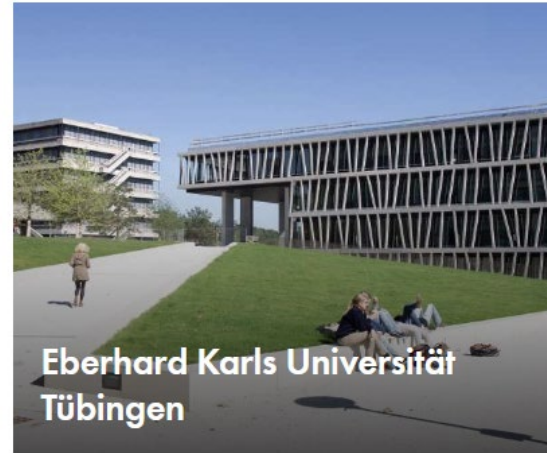
Eberhard Karls Universität Tübingen