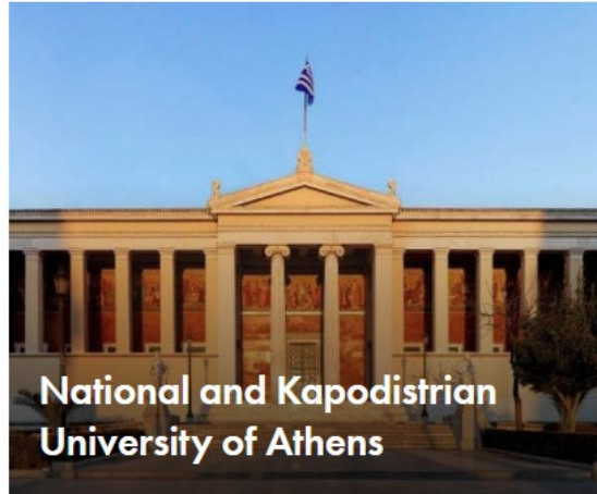
National and Kapodistrian University of Athens