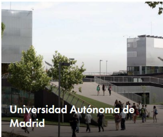
Universidad Autónoma de Madrid