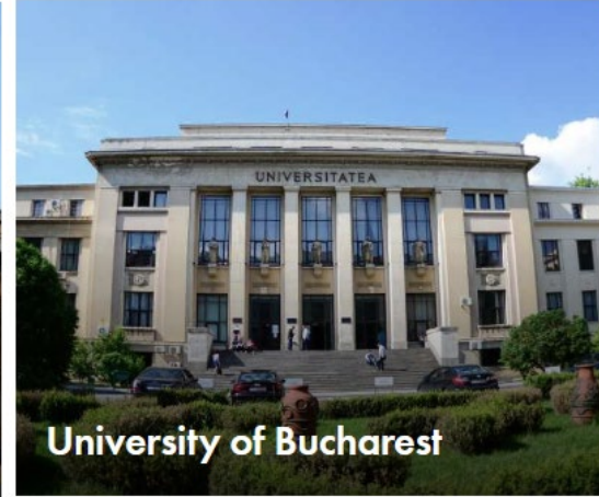
University of Bucharest